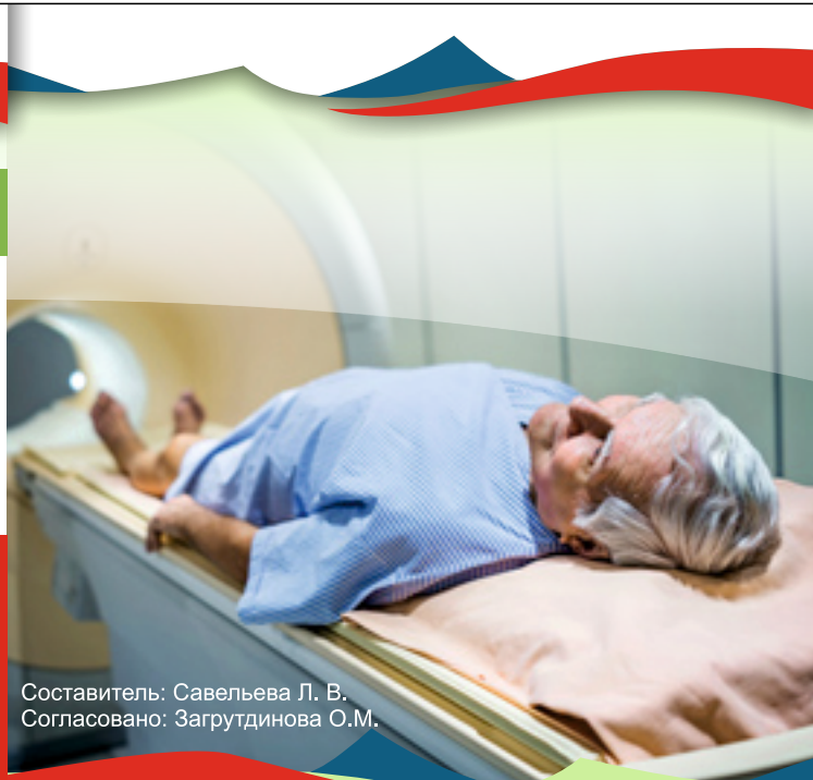
Составитель: Савельева Л. В. Согласовано: Загруддинова О.М.

ВЛАДИВОСТОКСКИЙ КЛИНИКО-ДИАГНОСТИЧЕСКИЙ ЦЕНТР ГОРОДСКОЙ ЦЕНТРА ЗДОРОВЬЯ ДЛЯ ВЗРОСЛЫХ И ДЕТЕЙ ☎ 8(423)226-38-11 📍 г. Владивосток, ул. Светланская, 131